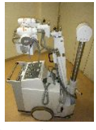
ポータブル撮影装置