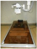
骨格系臥位撮影装置