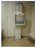
胸部・腹部立位撮影装置