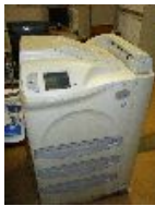
レーザーイメージャー