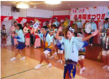
ほがらか連の皆さんの勇壮な踊り風景