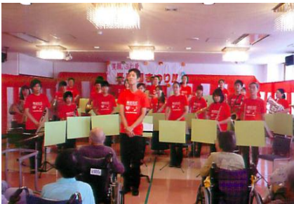
鴨島ウインドアンサンブルの皆さんの 優美な演奏風景

今年も、9月15日に恒例の長寿園祭りが開催されました。今年ゲストに「ほがらか連」の皆様、「鴨島ウインドアンサンブル」の皆様にお越しいただきました。入所者の皆様やご家族様も、馴染み深いよしこのリズムに心弾ませ、また、普段中々聞くことのできない「吹奏楽」の音色に心癒され、和やかな雰囲気の中で、ともに時間を過ごすことができました。また、「お楽しみ」として毎年入所者の皆様から期待されている？職員による「かくし芸」の披露や「模擬店」などもあり、出席された入所者の皆様が、童心に帰って喜ばれておられるお姿がとても印象的でした。こうしたイベントのひとつまひとつこまが心に残るものになっていただければ幸いです。